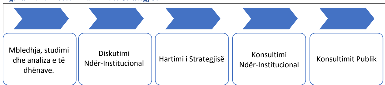
Figura nr. 1: Procesi i Hartimit të Strategjisë